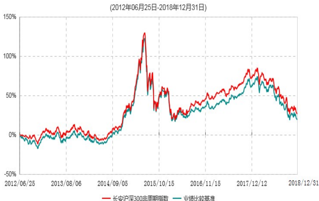
长安沪深300非周期行业指数证券投资基金累计净值增长率与业绩比较基准收益率历史走势对比图

根据基金合同的规定,自基金合同生效之日起6个月内基金各项资产配置比例需符合基金合同要求。本基金在建仓期结束后,各项资产配置比例已符合基金合同有关投资比例的约定。图示日期为2012年6月25日至2018年12月31日。