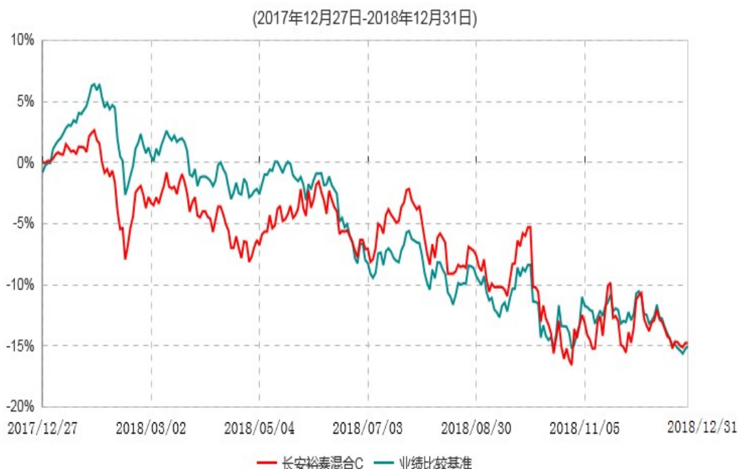
长安裕泰混合C累计净值增长率与业绩比较基准收益率历史走势对比图

根据基金合同的规定,自基金合同生效之日起 6 个月内基金各项资产配置比例需符合基金合同要求。本基金在建仓期结束后,各项资产配置比例已符合基金合同有关投资比例的约定。基金合同生效日至报告期期末,本基金运作时间超过一年。图示日期为 2017 年 12 月 27 日至 2018 年 12 月 31 日。