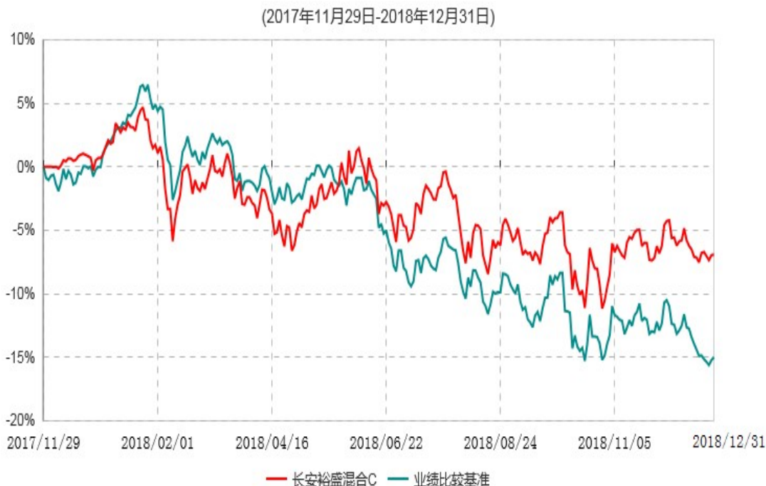
长安裕盛混合C累计净值增长率与业绩比较基准收益率历史走势对比图

根据基金合同的规定,自基金合同生效之日起6个月内基金各项资产配置比例需符合基金合同要求。本基金在建仓期结束后,各项资产配置比例已符合基金合同有关投资比例的约定。基金合同生效日至报告期期末,本基金运作时间超过一年。图示日期为2017年11月29日至2018年12月31日。