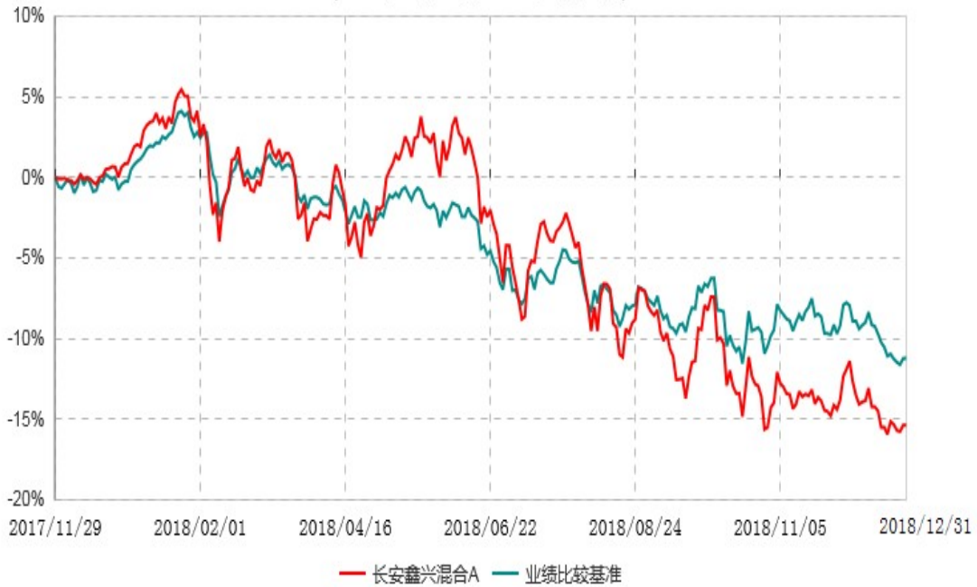
长安鑫兴混合A累计净值增长率与业绩比较基准收益率历史走势对比图 (2017年11月29日-2018年12月31日)

根据基金合同的规定,自基金合同生效之日起6个月内基金各项资产配置比例需符合基金合同要求。截止到建仓期结束时,本基金的各项投资组合比例已符合基金合同的相关规定。基金合同生效日至报告期期末,本基金运作时间已满一年。图示日期为2017年11月29日至2018年12月31日。