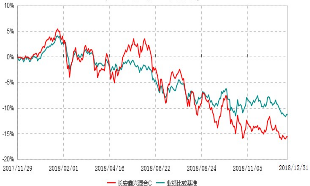
长安鑫兴混合C累计净值增长率与业绩比较基准收益率历史走势对比图 (2017年11月29日-2018年12月31日)

根据基金合同的规定,自基金合同生效之日起6个月内基金各项资产配置比例需符合基金合同要求。截止到建仓期结束时,本基金的各项投资组合比例已符合基金合同的相关规定。基金合同生效日至报告期期末,本基金运作时间已满一年。图示日期为2017年11月29日至2018年12月31日。