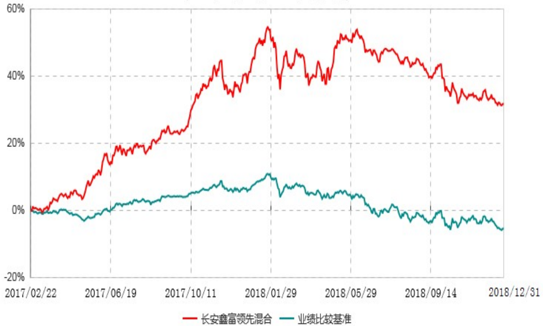
长安鑫富领先灵活配置混合型证券投资基金累计净值增长率与业绩比较基准收益率历史走势对比图 (2017年02月22日-2018年12月31日)

根据基金合同的规定,自基金合同生效之日起6个月内基金各项资产配置比例需符合基金合同要求。本基金在建仓期结束后,各项资产配置比例已符合基金合同有关投资比例的约定。基金合同生效日至报告期期末,本基金运作时间超过一年。图示日期为2017年2月22日至2018年12月31日。