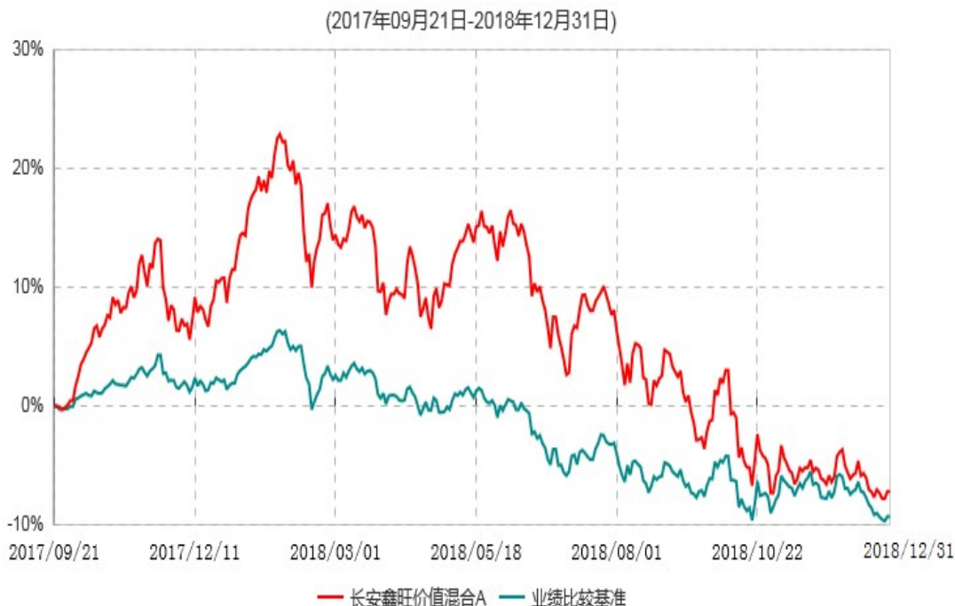
长安鑫旺价值混合A累计净值增长率与业绩比较基准收益率历史走势对比图

根据基金合同的规定,自基金合同生效之日起6个月内基金各项资产配置比例需符合基金合同要求。本基金在建仓期结束后,各项资产配置比例已符合基金合同有关投资比例的约定。基金合同生效日至报告期期末,本基金运作时间已满一年。图示日期为2017年9月21日至2018年12月31日。