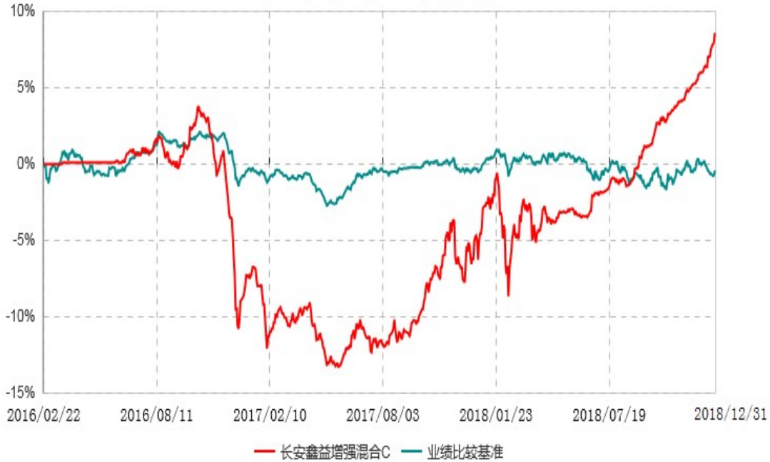
长安鑫益增强混合C累计净值增长率与业绩比较基准收益率历史走势对比图 (2016年02月22日-2018年12月31日)

本基金基金合同生效日为 2016 年 02 月 22 日，基金合同生效日至报告期期末，本基金运作时间超过一年。根据基金合同的规定，自基金合同生效之日起 6 个月内基金各项资产配置比例需符合基金合同要求。本基金在建仓期结束后，各项资产配置比例已符合基金合同有关投资比例的约定。图示日期为 2016 年 02 月 22 日至 2018 年 12 月 31 日。