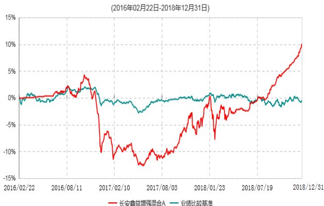
长安鑫益增强混合A累计净值增长率与业绩比较基准收益率历史走势对比图

本基金基金合同生效日为 2016 年 02 月 22 日，基金合同生效日至报告期期末，本基金运作时间超过一年。根据基金合同的规定，自基金合同生效之日起 6 个月内基金各项资产配置比例需符合基金合同要求。本基金在建仓期结束后，各项资产配置比例已符合基金合同有关投资比例的约定。图示日期为 2016 年 02 月 22 日至 2018 年 12 月 31 日。