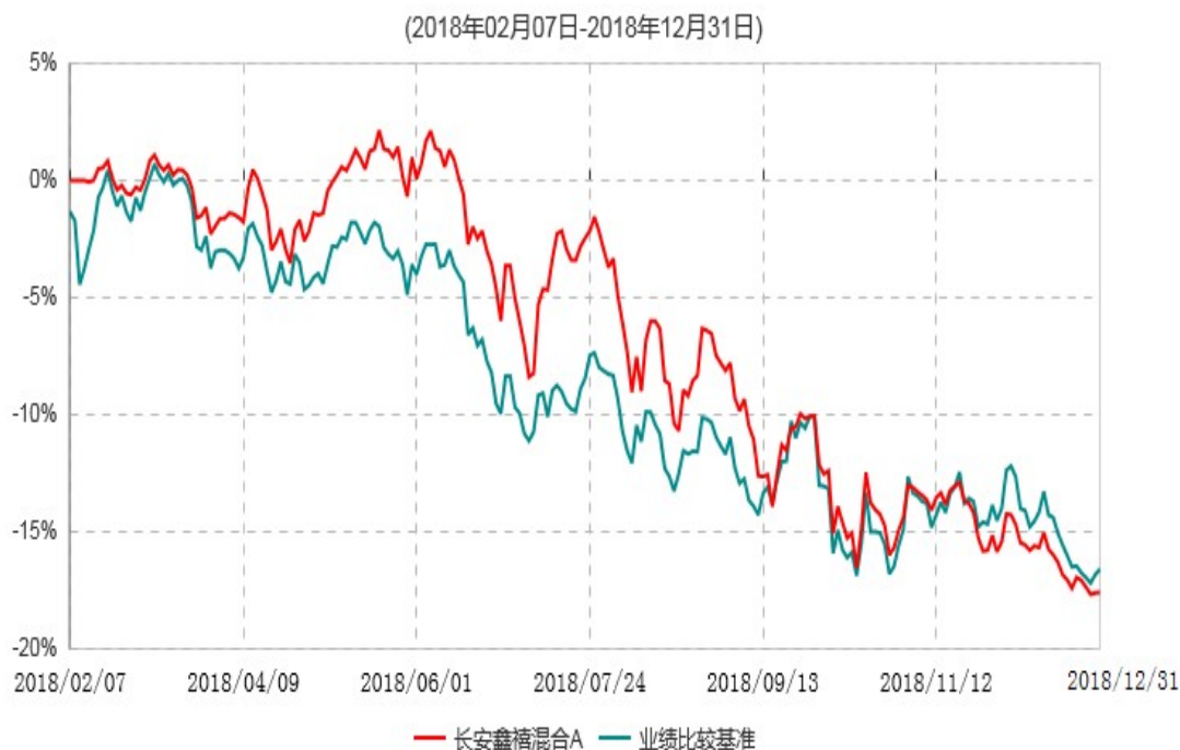
长安鑫禧混合A累计净值增长率与业绩比较基准收益率历史走势对比图

根据基金合同的规定,自基金合同生效之日起 6 个月内基金各项资产配置比例需符合基金合同要求。本基金在建仓期结束后,各项资产配置比例已符合基金合同有关投资比例的约定。图示日期为 2018 年 02 月 07 日至 2018 年 12 月 31 日。