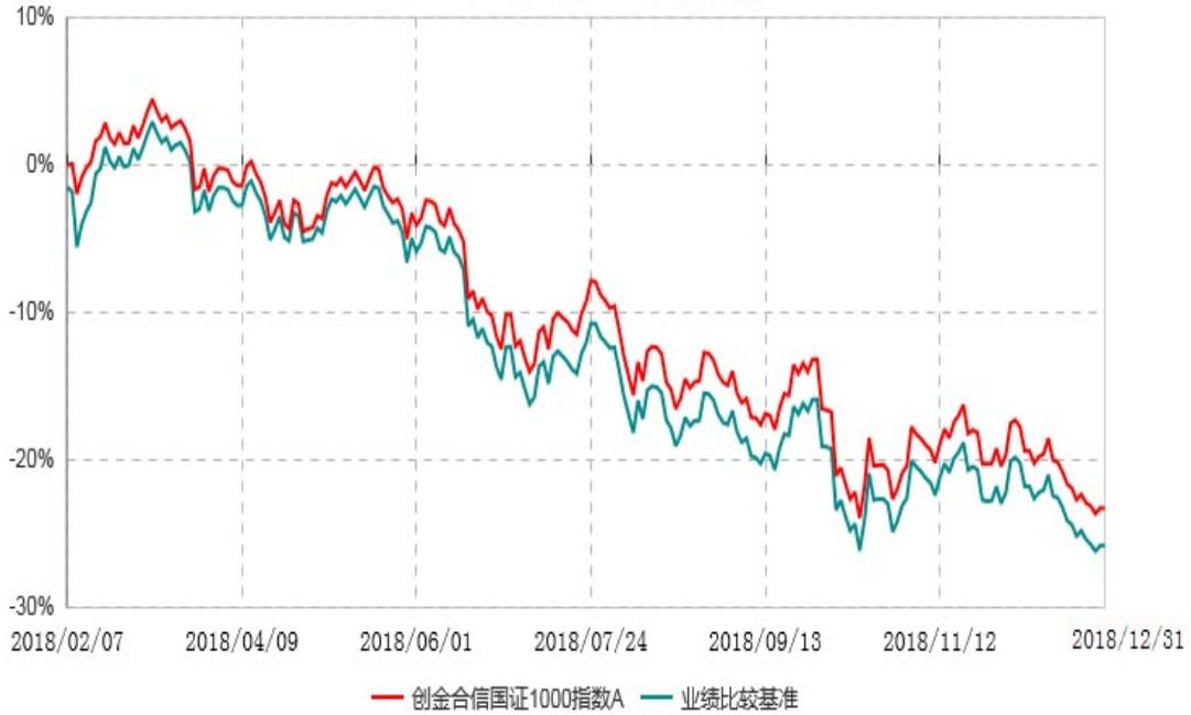
创金合信国证1000指数C累计净值增长率与业绩比较基准收益率历史走势对比图