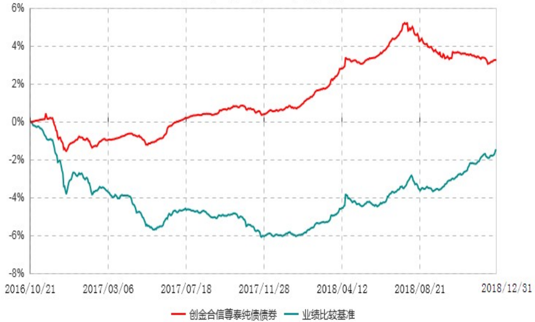
创金合信尊泰纯债债券型证券投资基金累计净值增长率与业绩比较基准收益率历史走势对比图 (2016年10月21日-2018年12月31日)