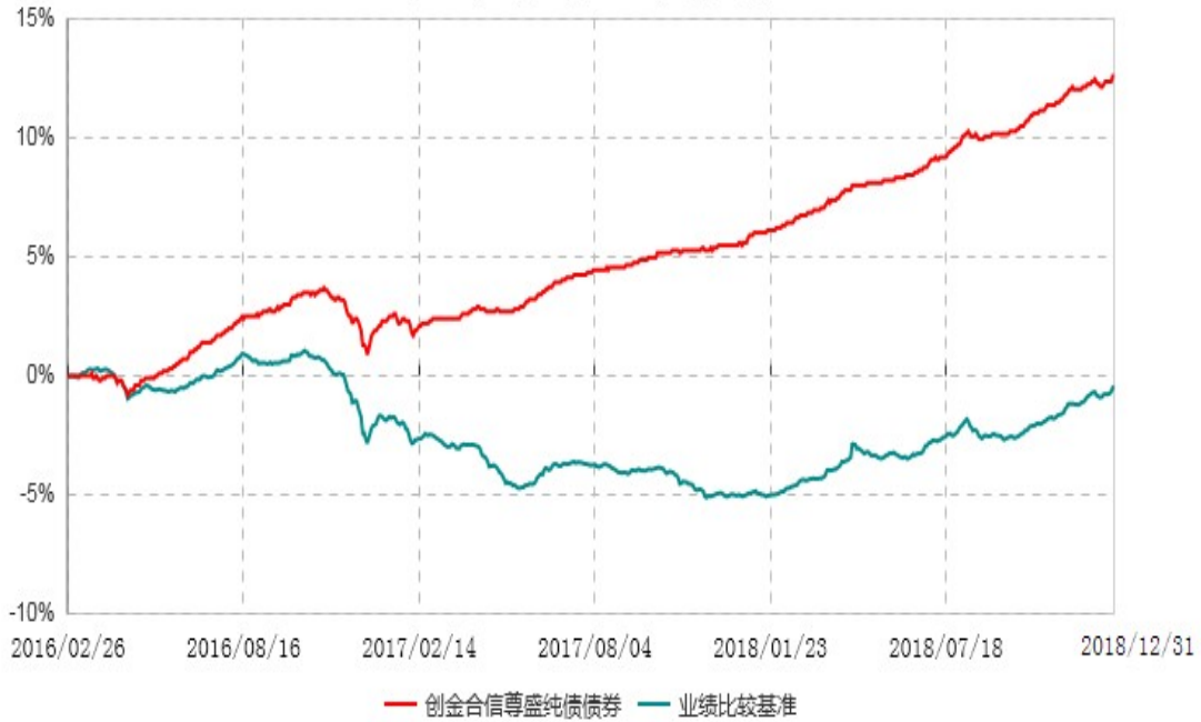
创金合信尊盛纯债债券型证券投资基金累计净值增长率与业绩比较基准收益率历史走势对比图 (2016年02月26日-2018年12月31日)