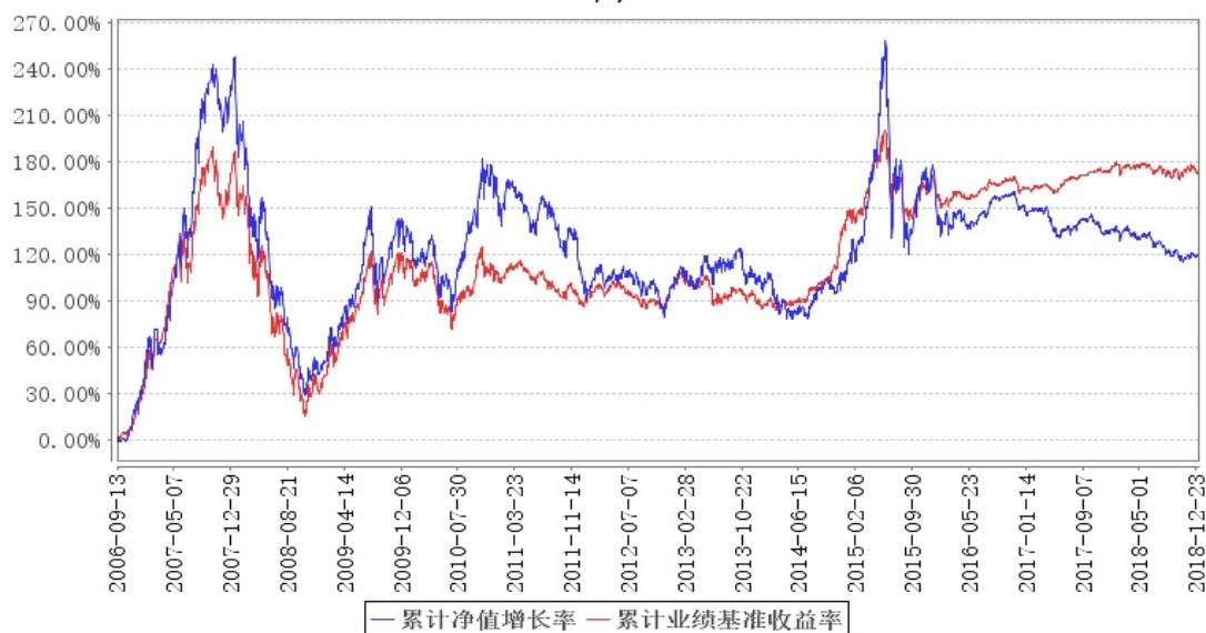
大成2020生命周期混合累计净值增长率与同期业绩比较基准收益率的历史走势对比图

注：1. 本基金合同规定，基金管理人应当自基金合同生效之日起六个月内使基金的投资组合比例符合基金合同的约定。建仓期结束时，本基金的投资组合比例符合基金合同的约定。