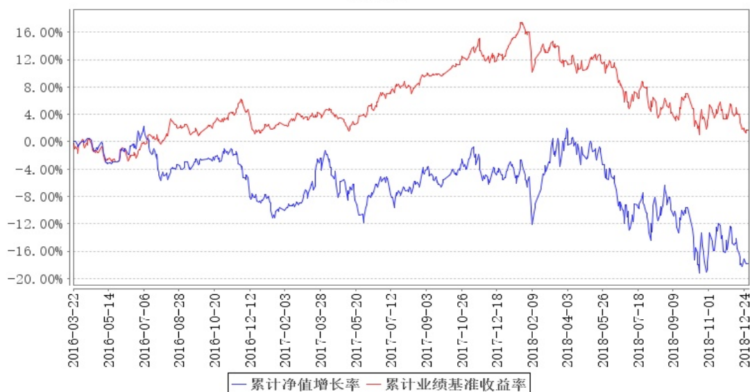
大成趋势回报灵活配置混合累计净值增长率与同期业绩比较基准收益率的历史走势对比图

注：本基金合同规定，基金管理人应当自基金合同生效日起六个月内使基金的投资组合比例符合基金合同的约定。建仓期结束时，本基金的投资组合比例符合基金合同的约定。