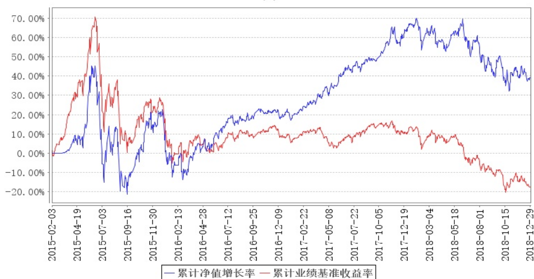
大成高新技术产业股票累计净值增长率与同期业绩比较基准收益率的历史走势对比图

注:本基金合同规定,基金管理人应当自基金合同生效日起六个月内使基金的投资组合比例符合基金合同的约定。建仓期结束时,本基金的投资组合比例符合基金合同的约定。