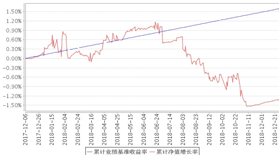
安信阿尔法定开混合累计净值增长率与同期业绩比较基准收益率的历史走势对比图