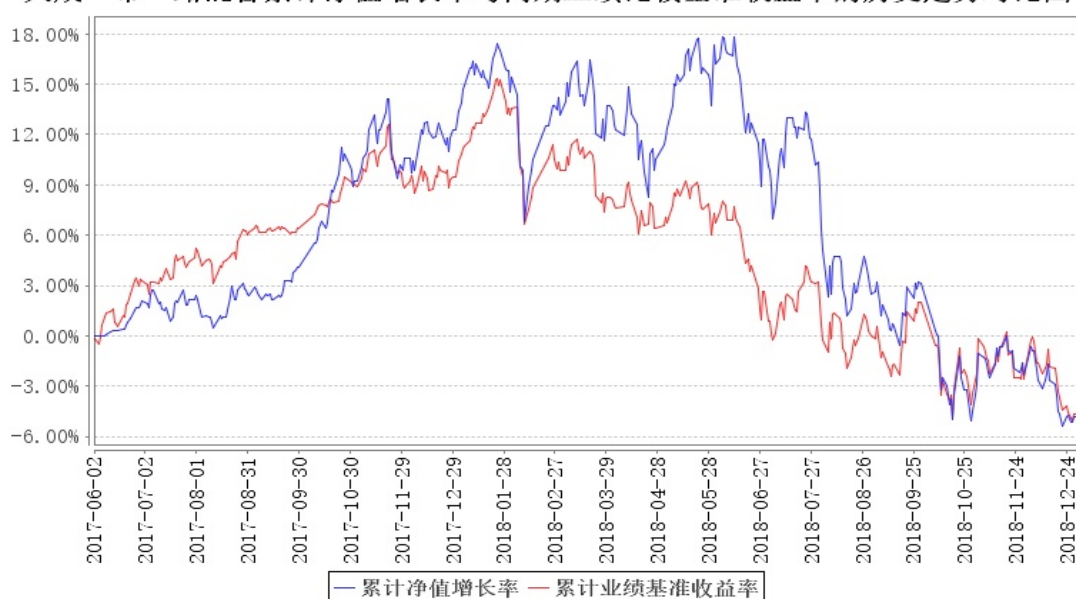
大成一带一路混合累计净值增长率与同期业绩比较基准收益率的历史走势对比图

注：按基金合同规定，基金管理人应当自基金合同生效之日起六个月内使基金的投资组合比例符合基金合同的有关约定。截至建仓期结束时，本基金的各项投资比例已达到基金合同中规定的比例。