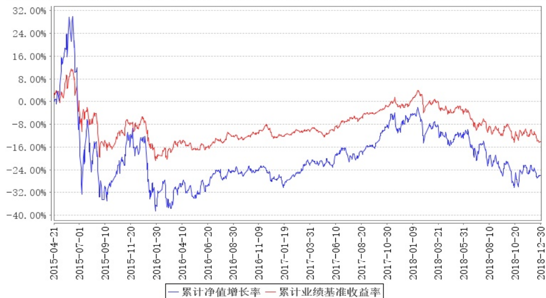
大成互联网思维混合累计净值增长率与同期业绩比较基准收益率的历史走势对比图

注：本基金合同规定，基金管理人应当自基金合同生效之日起六个月内使基金的投资组合比例符合基金合同的约定。建仓期结束时，本基金的投资组合比例符合基金合同的约定。