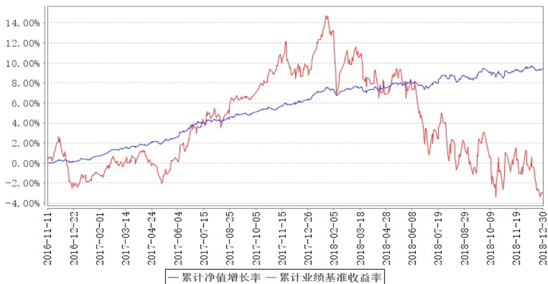
大成景尚灵活配置混合A累计净值增长率与同期业绩比较基准收益率的历史走势对比图