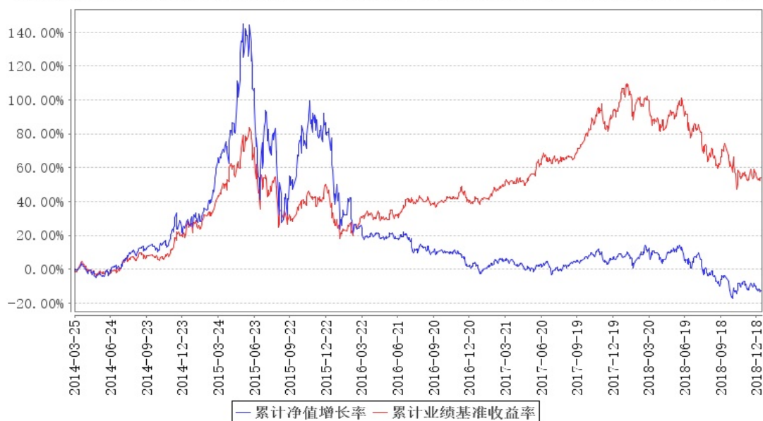
大成消费主题混合累计净值增长率与同期业绩比较基准收益率的历史走势对比图

注:1、按《大成消费主题股票型证券投资基金基金合同》规定,基金管理人应当自2014年3月25日(基金合同生效日)起六个月内使基金的投资组合比例符合基金合同的约定。建仓期结束时,本基金的投资组合比例符合基金合同的约定。