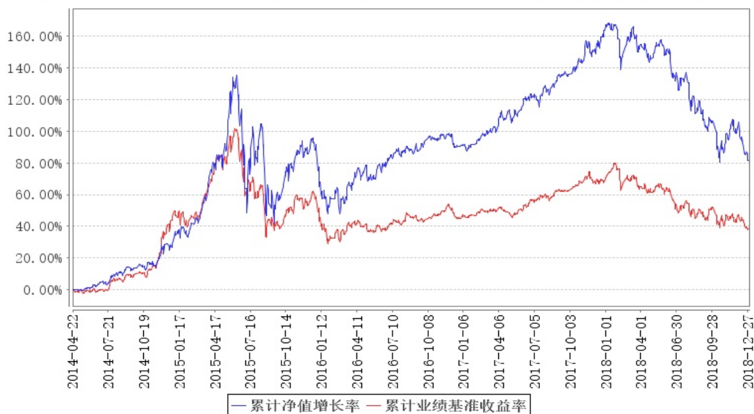
大成竞争优势混合累计净值增长率与同期业绩比较基准收益率的历史走势对比图

注:本基金由大成保本混合型证券投资基金第一个保本周期到期后转型而来。本基金合同规定, 第 7 页 共 56 页