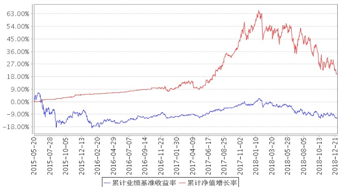
安信优势增长混合A累计净值增长率与同期业绩比较基准收益率的历史走势对比图