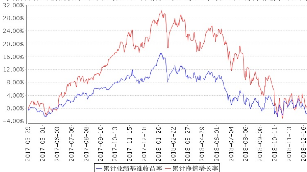
安信合作创新混合累计净值增长率与同期业绩比较基准收益率的历史走势对比图