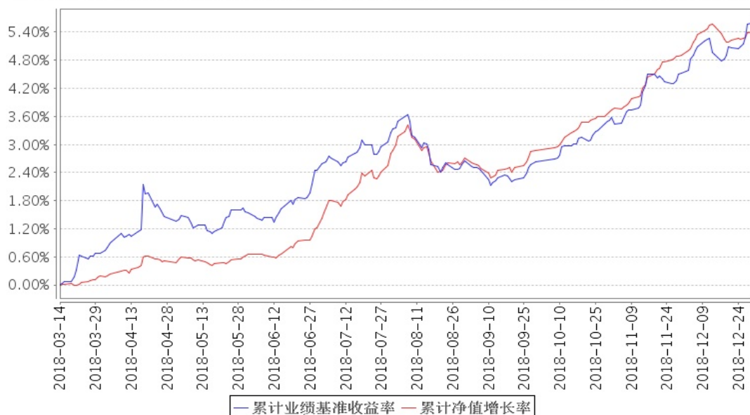
安信尊享添益债券累计净值增长率与同期业绩比较基准收益率的历史走势对比图

注：1、本基金合同生效日为 2018 年 3 月 14 日，截至报告期末本基金合同生效未满一年。