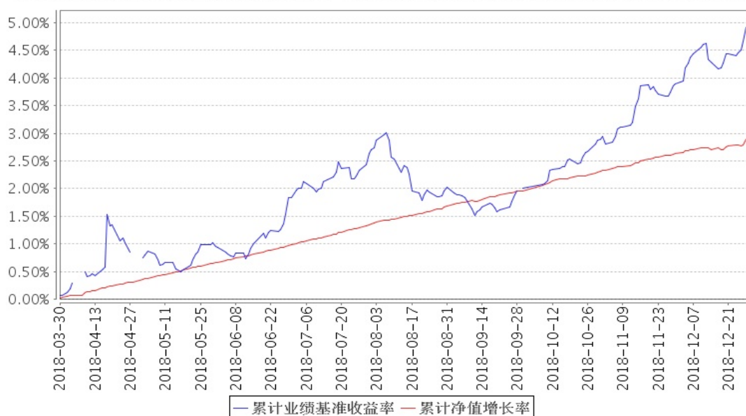
安信永盛定开债券累计净值增长率与同期业绩比较基准收益率的历史走势对比图

注:1、本基金合同生效日为 2018 年 3 月 30 日,截至报告期末本基金合同生效未满一年。