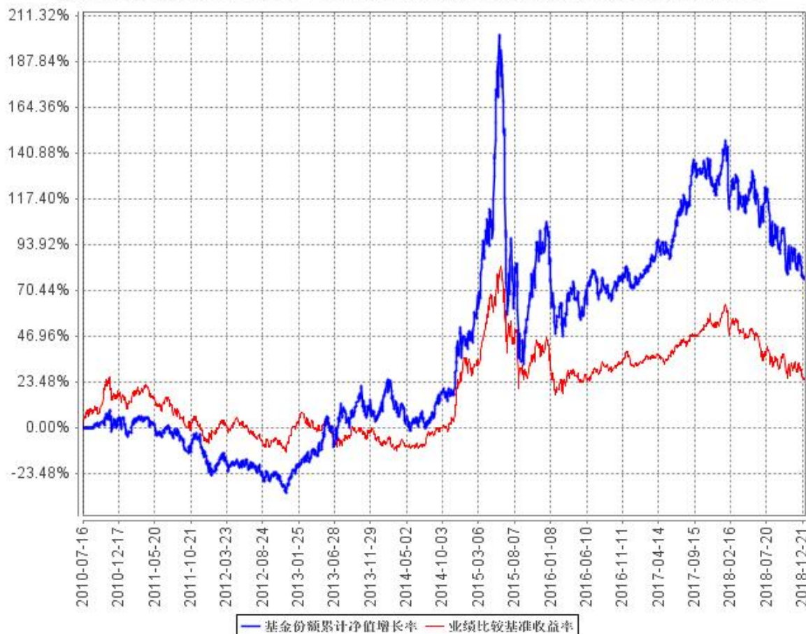
基金份额累计净值增长率与同期业绩比较基准收益率的历史走势对比图