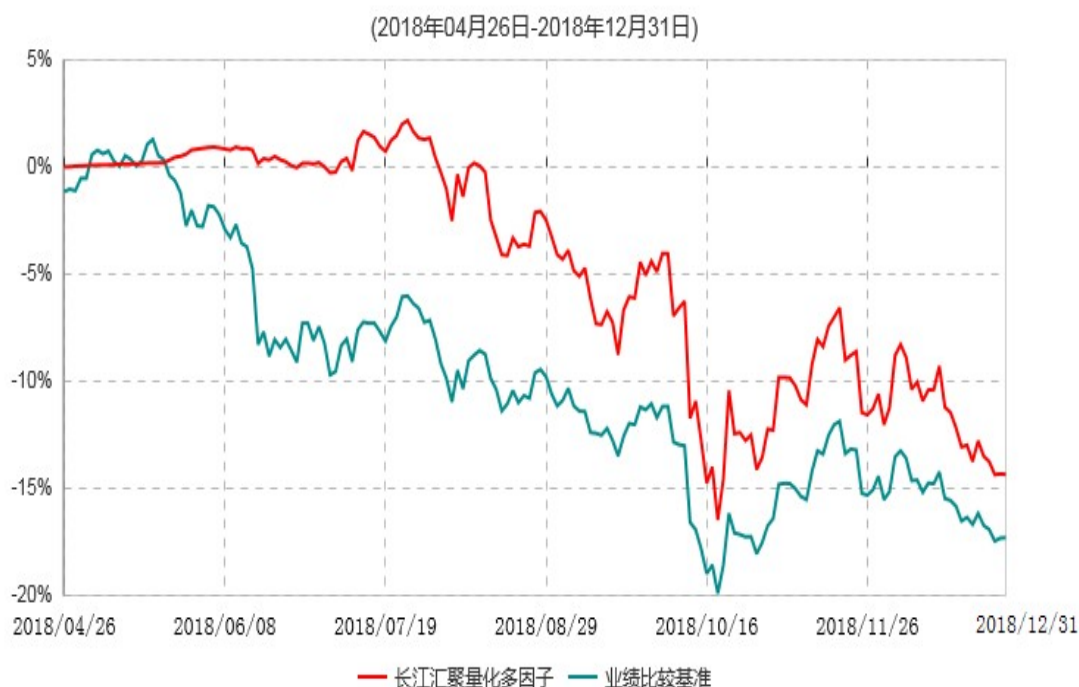
长江汇聚量化多因子灵活配置混合型发起式证券投资基金累计净值增长率与业绩比较基准收益率历史走势对比图

注：（1）本基金基金合同于2018年4月26日生效，截至本报告期末未满一年；（2）本基金建仓期为基金合同生效日起6个月内，建仓期结束时各项资产配置比例均符合基金合同约定。