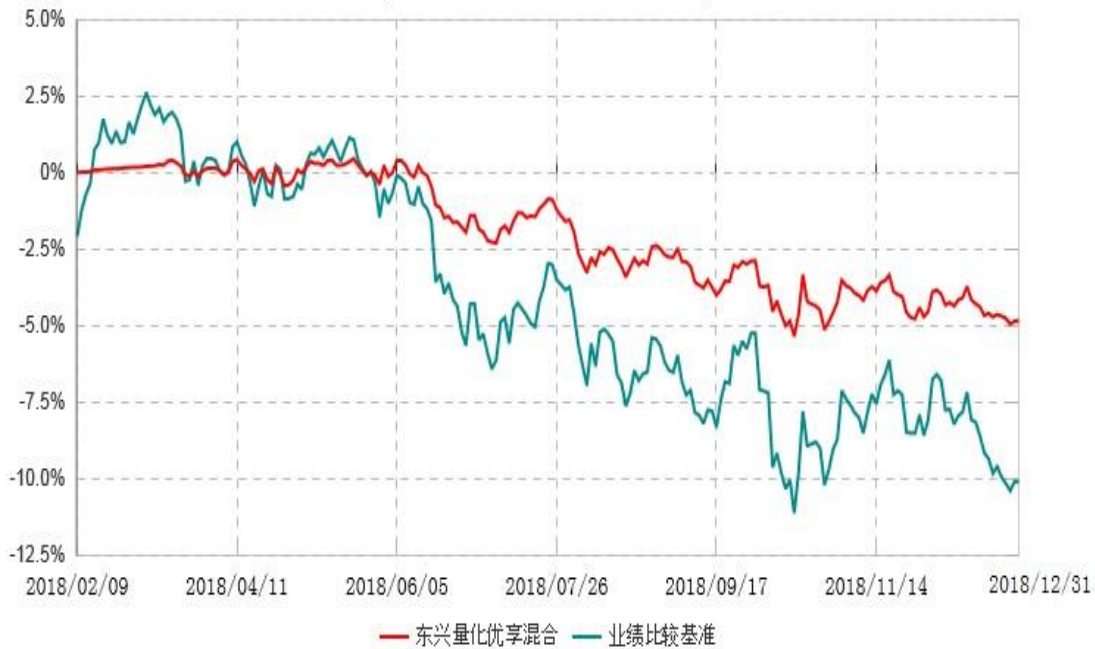
东兴量化优享灵活配置混合型证券投资基金累计净值增长率与业绩比较基准收益率历史走势对比图 (2018年02月09日-2018年12月31日)

注：1、本基金基金合同生效日为2018年2月9日，根据相关法律法规和基金合同，本基金建仓期为基金合同生效之日起6个月内，截至本报告期末已完成建仓但距建仓结束不满一年；