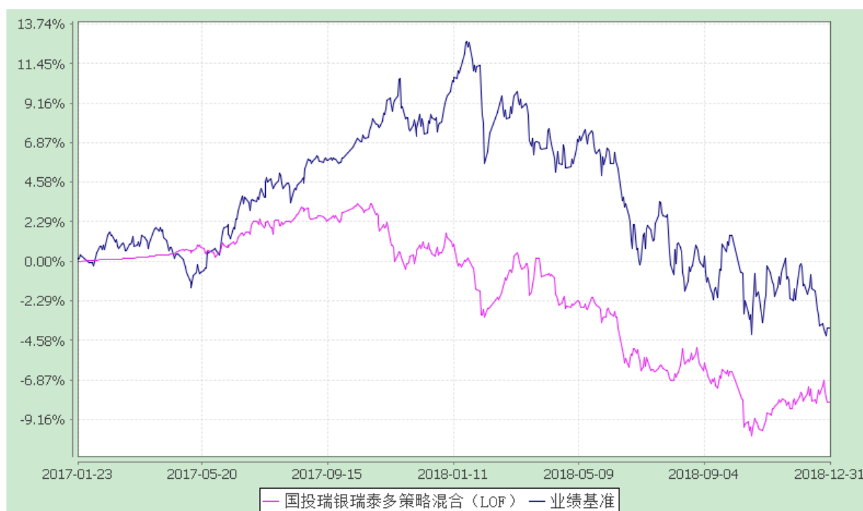
国投瑞银瑞泰多策略灵活配置混合型证券投资基金（LOF） 份额累计净值增长率与业绩比较基准收益率的历史走势对比图 (2017 年 1 月 23 日至 2018 年 12 月 31 日)

注：本基金建仓期为自基金合同生效日起的六个月。截至建仓期结束，本基金各项资产配置比例符合基金合同及招募说明书有关投资比例的约定。