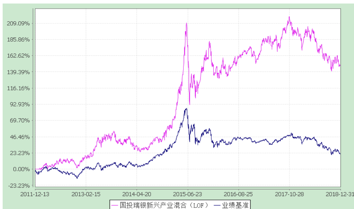
国投瑞银新兴产业混合型证券投资基金(LOF) 份额累计净值增长率与业绩比较基准收益率的历史走势对比图 (2011 年 12 月 13 日至 2018 年 12 月 31 日)

注：本基金建仓期为自基金合同生效日起的 6 个月。截至建仓期结束，本基金各项资产配置比例符合基金合同及招募说明书有关投资比例的约定。