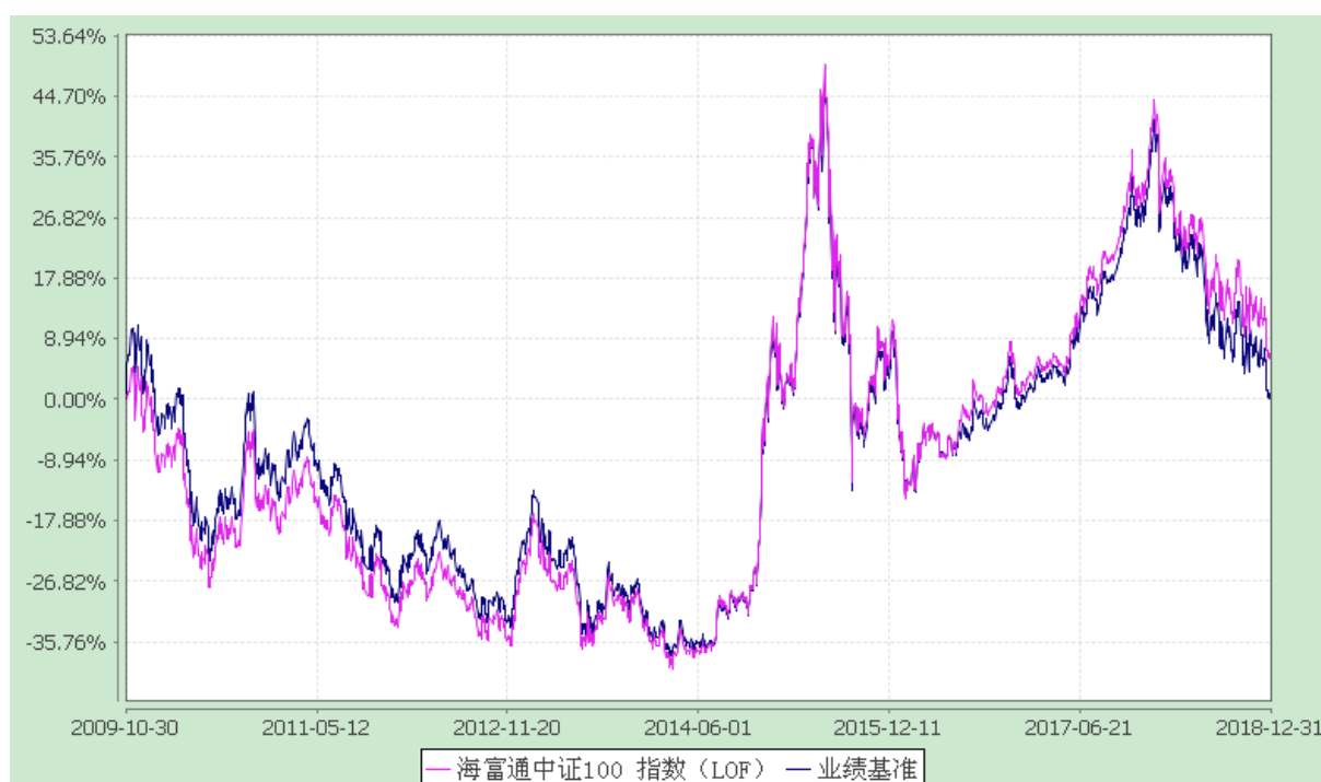
海富通中证 100 指数证券投资基金 (LOF) 份额累计净值增长率与业绩比较基准收益率的历史走势对比图 (2009 年 10 月 30 日至 2018 年 12 月 31 日)

注: 按照本基金合同规定, 本基金建仓期为基金合同生效之日起六个月。建仓期满至今, 本基金投资组合均达到本基金合同第十五条 (二)、(七) 规定的比例限制及本基金投资组合的比例范围。