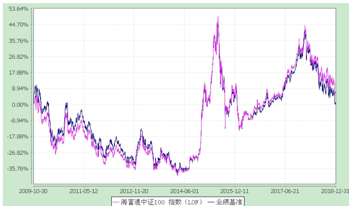
海富通中证 100 指数证券投资基金 (LOF) 份额累计净值增长率与业绩比较基准收益率的历史走势对比图 (2009 年 10 月 30 日至 2018 年 12 月 31 日)

注：按照本基金合同规定，本基金建仓期为基金合同生效之日起六个月。建仓期满至今，本基金投资组合均达到本基金合同第十五条（二）、（七）规定的比例限制及本基金投