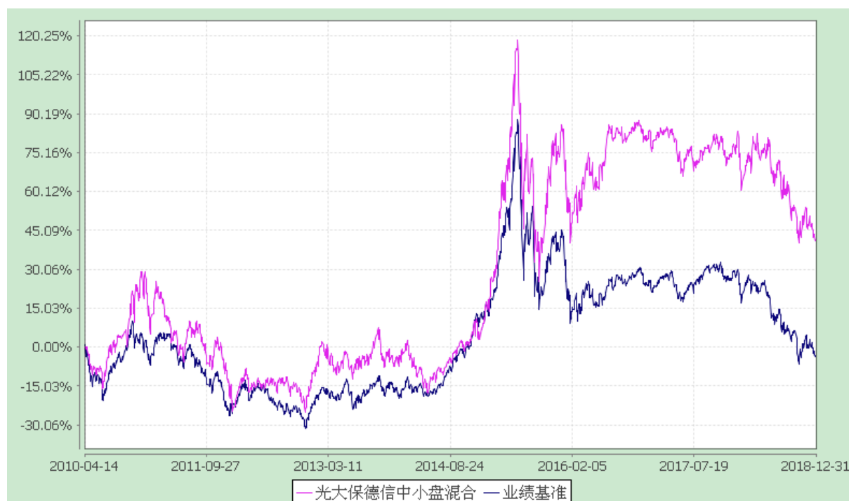
光大保德信中小盘混合型证券投资基金 份额累计净值增长率与业绩比较基准收益率的历史走势对比图 (2010 年 4 月 14 日至 2018 年 12 月 31 日)