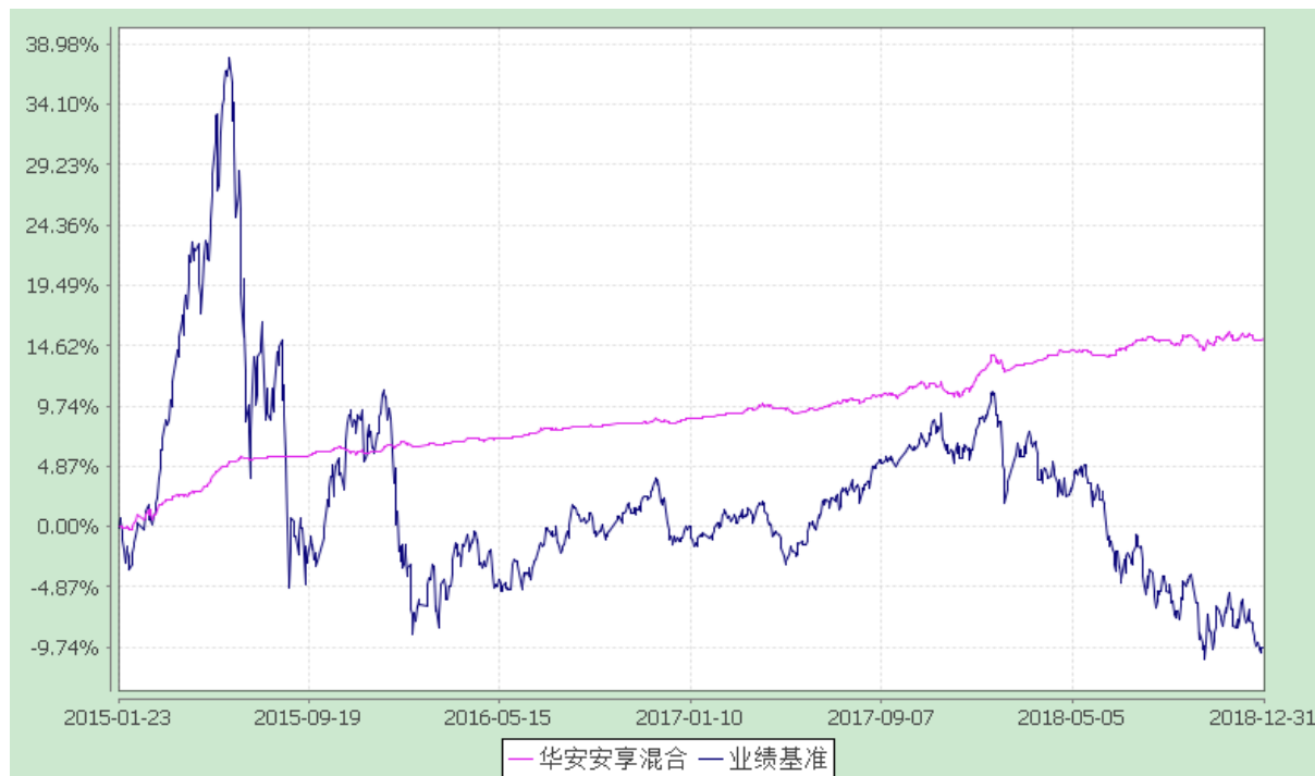
华安安享灵活配置混合型证券投资基金 份额累计净值增长率与业绩比较基准收益率的历史走势对比图 (2015 年 1 月 23 日至 2018 年 12 月 31 日)