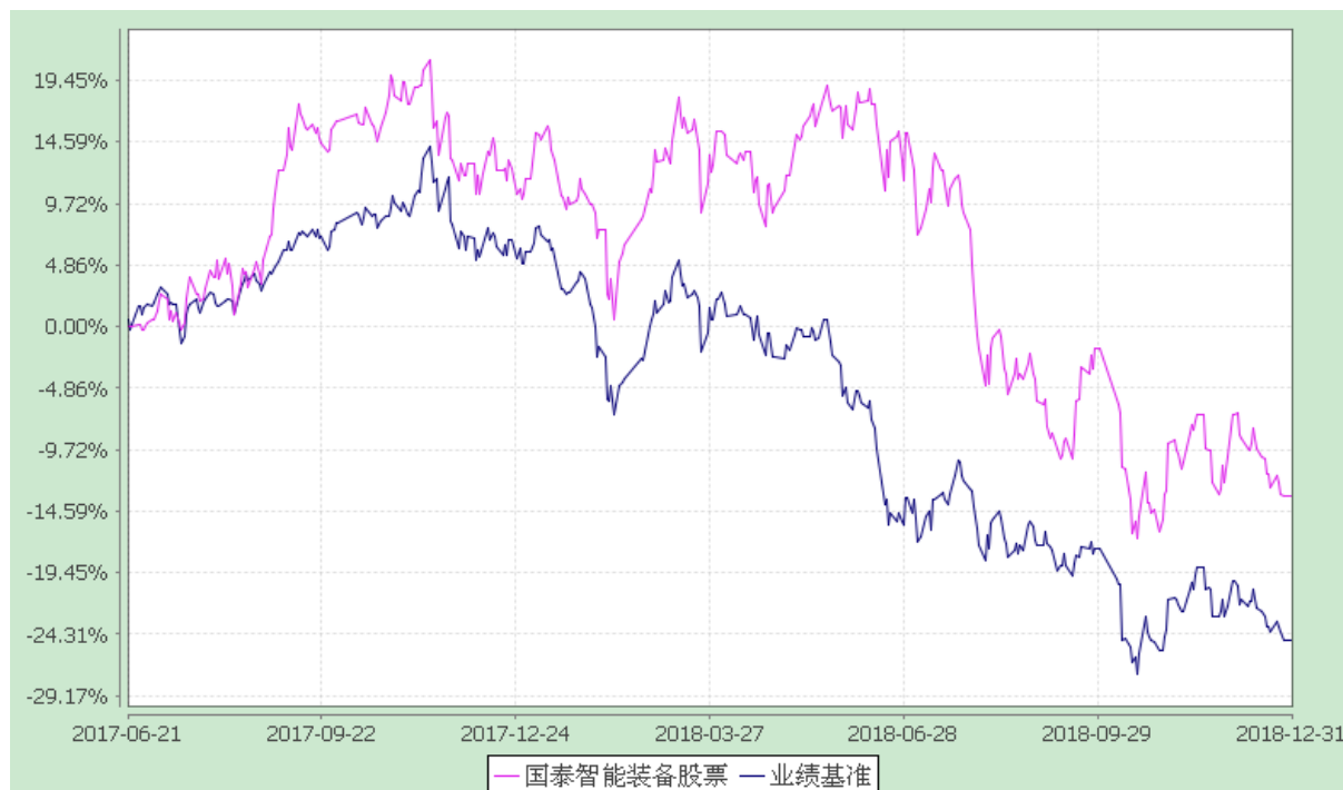
自基金合同生效以来份额累计净值增长率与业绩比较基准收益率的历史走势对比图 (2017 年 6 月 21 日至 2018 年 12 月 31 日)

注：本基金合同生效日为 2017 年 6 月 21 日，本基金的建仓期为 6 个月，在建仓期结束时，各项资产配置比例符合合同约定。