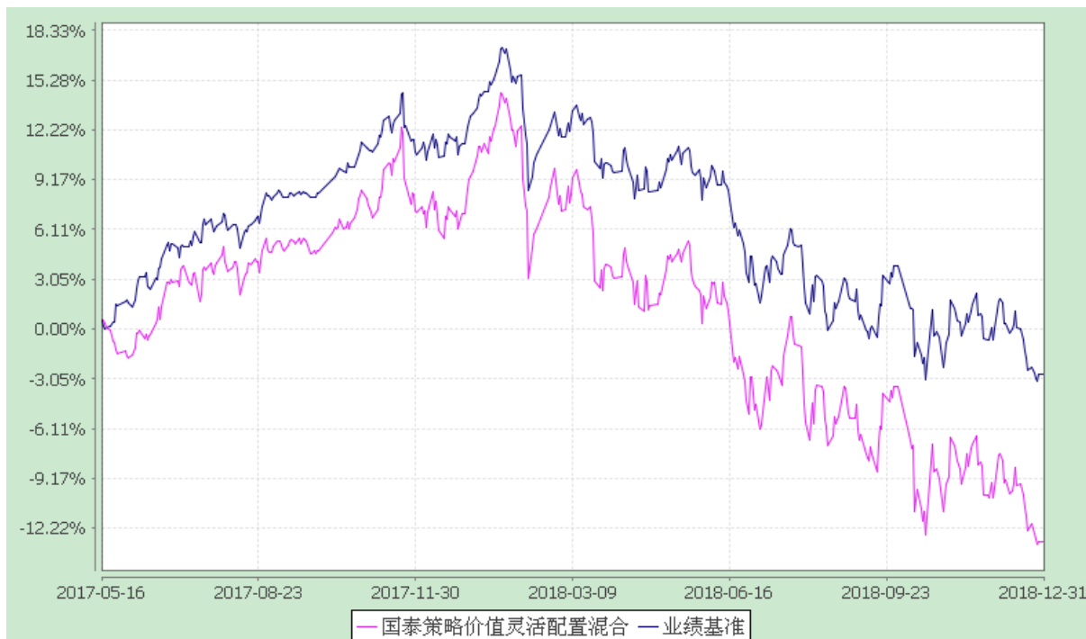
自基金转型以来份额累计净值增长率与业绩比较基准收益率的历史走势对比图 (2017 年 5 月 16 日至 2018 年 12 月 31 日)

注：本基金合同生效日为 2017 年 5 月 16 日，本基金在六个月建仓期结束时，各项资产配置比例符合合同约定。