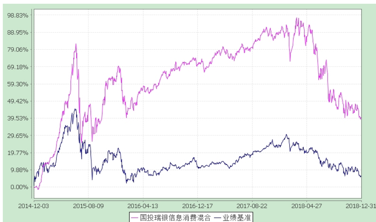
国投瑞银信息消费灵活配置混合型证券投资基金 份额累计净值增长率与业绩比较基准收益率的历史走势对比图 (2014 年 12 月 3 日至 2018 年 12 月 31 日)