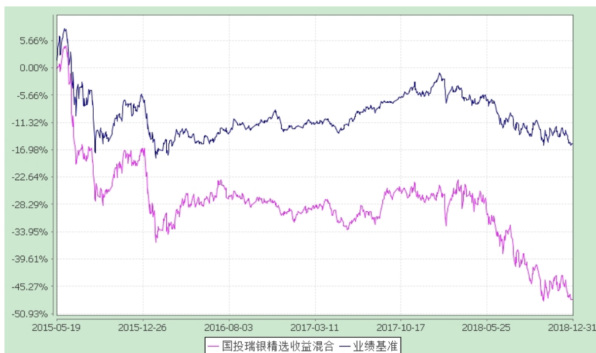
国投瑞银精选收益灵活配置混合型证券投资基金 份额累计净值增长率与业绩比较基准收益率的历史走势对比图 (2015 年 5 月 19 日至 2018 年 12 月 31 日)

注：本基金建仓期为自基金合同生效日起的 6 个月。截至建仓期结束，本基金各项资产配置比例符合基金合同及招募说明书有关投资比例的约定。