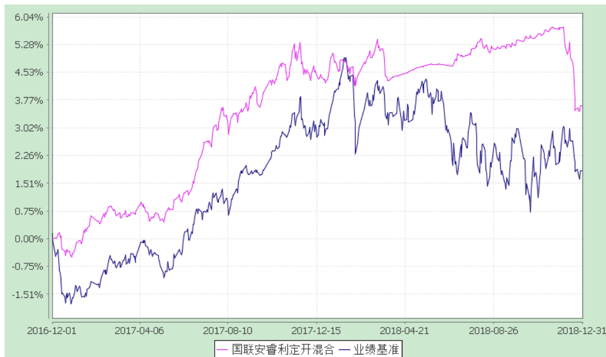
国联安睿利定期开放混合型证券投资基金 份额累计净值增长率与业绩比较基准收益率的历史走势对比图 (2016 年 12 月 1 日至 2018 年 12 月 31 日)

注：1、本基金业绩比较基准为：沪深 300 指数收益率×20%+上证国债指数收益率×80%； 2、本基金基金合同于 2016 年 12 月 1 日生效。本基金建仓期为自基金合同生效之日起的 6 个月，建仓期结束时各项资产配置符合合同约定； 3、上述基金业绩指标不包括持有人认购或交易基金的各项费用，计入费用后实际收益水平要低于所列数字。