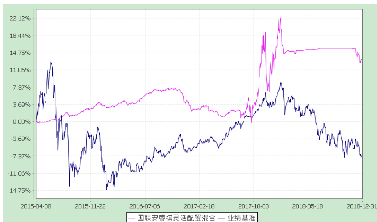
国联安睿祺灵活配置混合型证券投资基金 份额累计净值增长率与业绩比较基准收益率的历史走势对比图 (2015 年 4 月 8 日至 2018 年 12 月 31 日)

注：1、本基金业绩比较基准为：沪深 300 指数×50%+上证国债指数×50%；