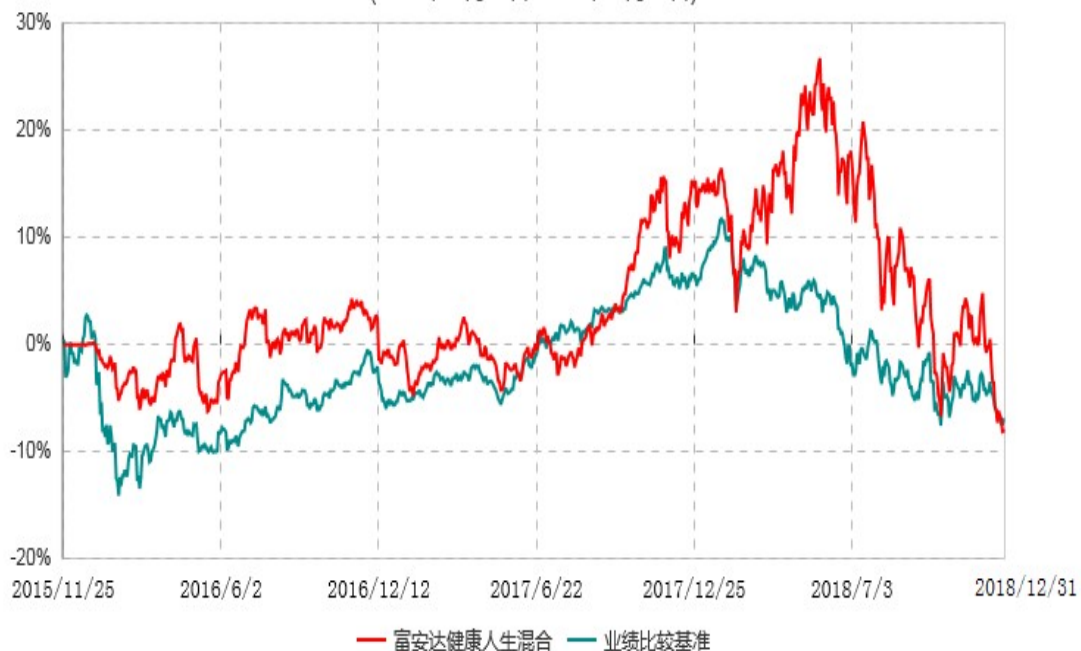
富安达健康人生灵活配置混合型证券投资基金累计净值增长率与业绩比较基准收益率历史走势对比图 (2015年11月25日-2018年12月31日)

根据《富安达健康人生灵活配置混合型证券投资基金基金合同》规定，本基金建仓期为6个月，建仓截止日为2016年5月24日。建仓期结束时本基金各项资产配置比例符合本基金合同规定的比例限制及投资组合的比例范围。