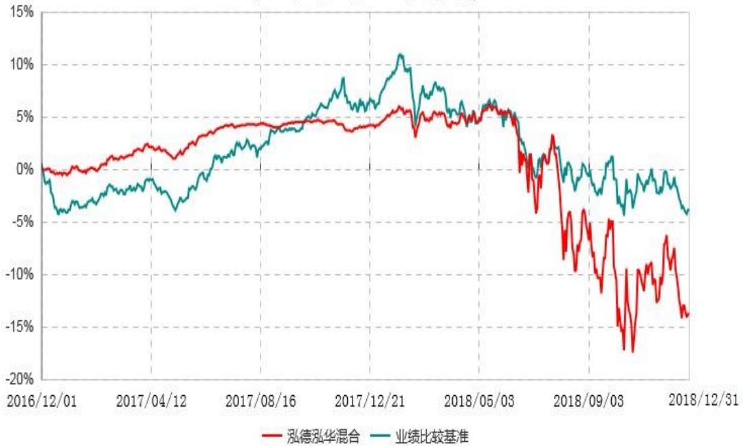
泓德泓华灵活配置混合型证券投资基金累计净值增长率与业绩比较基准收益率历史走势对比图 (2016年12月01日-2018年12月31日)

注：根据基金合同的约定，本基金建仓期为6个月，截至报告期末，本基金的各项投资比例符合基金合同关于投资范围及投资限制规定。