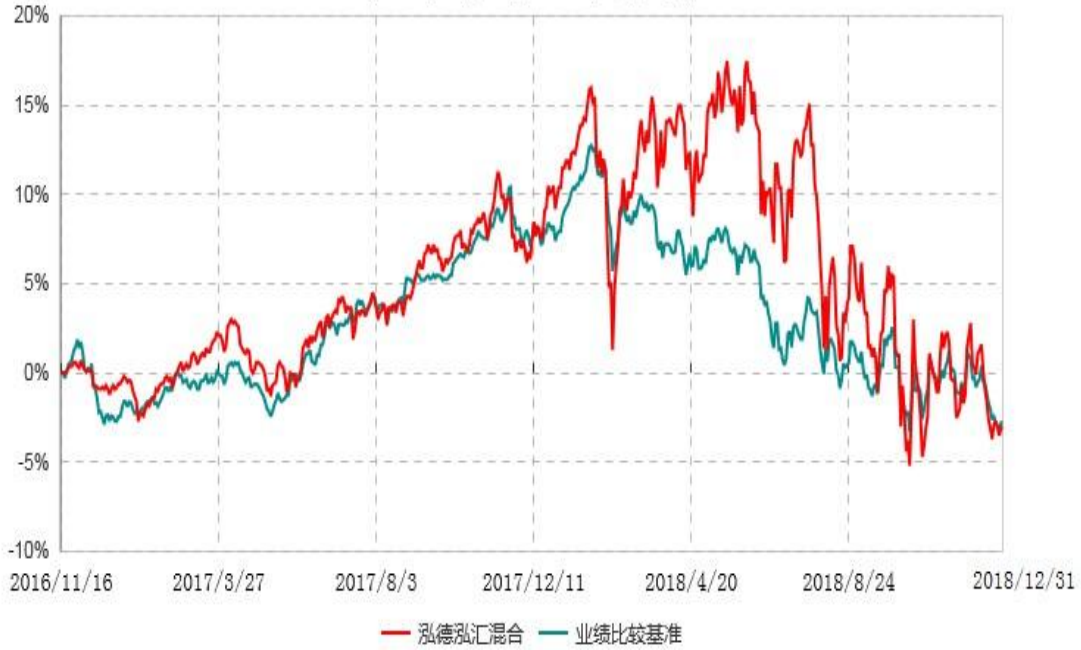
泓德泓汇灵活配置混合型证券投资基金累计净值增长率与业绩比较基准收益率历史走势对比图 (2016年11月16日-2018年12月31日)

注：根据基金合同的约定，本基金建仓期为6个月，截至报告期末，本基金的各项投资比例符合基金合同关于投资范围及投资限制规定。