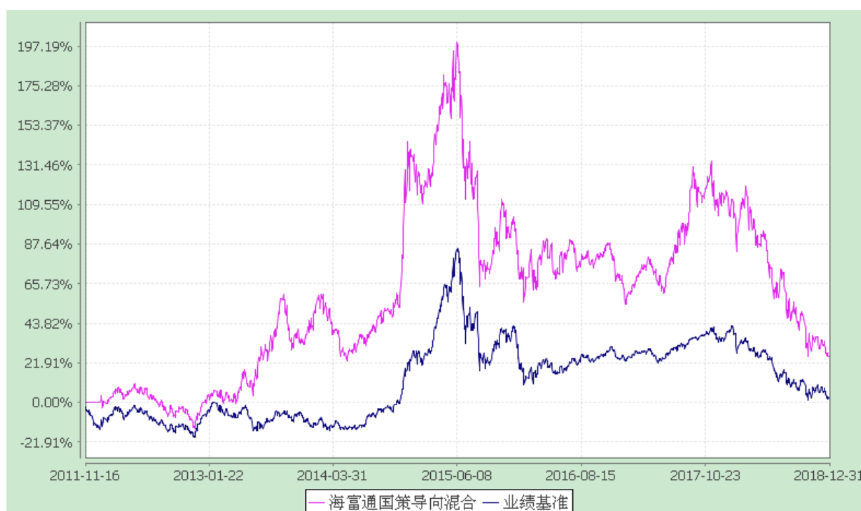
海富通国策导向混合型证券投资基金 份额累计净值增长率与业绩比较基准收益率的历史走势对比图 (2011 年 11 月 16 日至 2018 年 12 月 31 日)

注：按照本基金合同规定，本基金建仓期为基金合同生效之日起六个月。截至报告期末本基金的各项投资比例已达到基金合同第十四部分（二）投资范围、（七）投资限制中规定的各项比例。