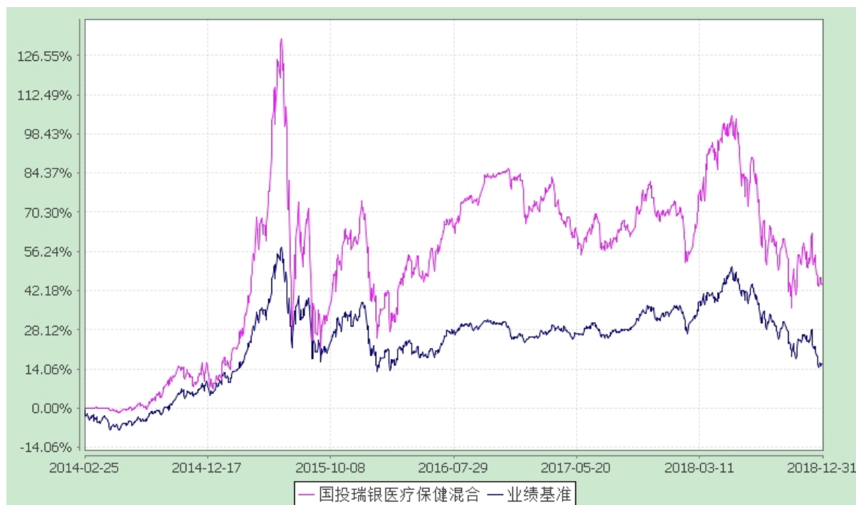
国投瑞银医疗保健行业灵活配置混合型证券投资基金 份额累计净值增长率与业绩比较基准收益率的历史走势对比图 (2014 年 2 月 25 日至 2018 年 12 月 31 日)

注：本基金建仓期为自基金合同生效日起的 6 个月。截至建仓期结束，本基金各项资产配置比例符合基金合同及招募说明书有关投资比例的约定。