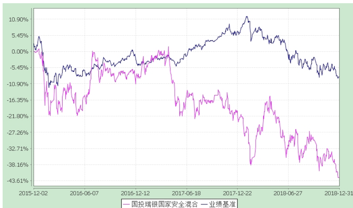
国投瑞银国家安全灵活配置混合型证券投资基金 份额累计净值增长率与业绩比较基准收益率的历史走势对比图 (2015 年 12 月 2 日至 2018 年 12 月 31 日)

注：本基金建仓期为自基金合同生效日起的 6 个月。截至建仓期结束，本基金各项资产配置比例符合基金合同及招募说明书有关投资比例的约定。