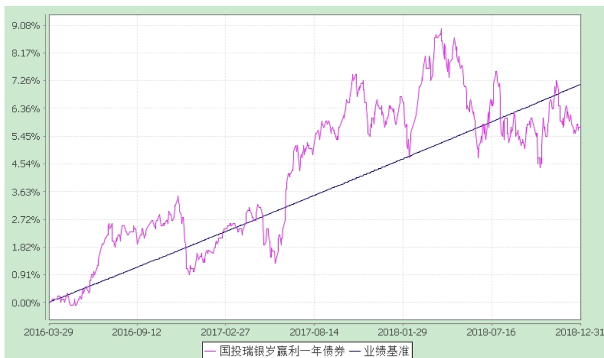
国投瑞银岁赢利一年期定期开放债券型证券投资基金 份额累计净值增长率与业绩比较基准收益率的历史走势对比图 (2016 年 3 月 29 日至 2018 年 12 月 31 日)

注：本基金建仓期为自基金合同生效日起的六个月。截至建仓期结束，本基金各项资产配置比例符合基金合同及招募说明书有关投资比例的约定。