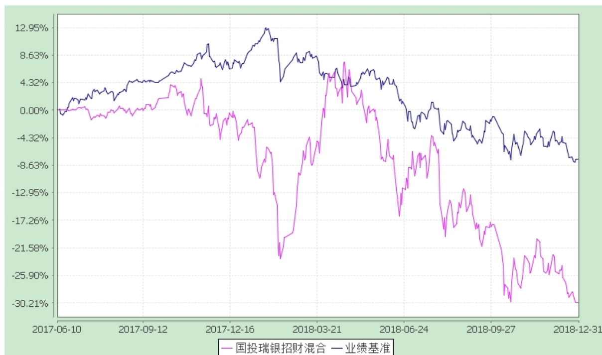
国投瑞银招财灵活配置混合型证券投资基金 份额累计净值增长率与业绩比较基准收益率的历史走势对比图 (2017 年 6 月 10 日至 2018 年 12 月 31 日)

注：本基金建仓期为自基金转型日起的六个月。截至建仓期结束，本基金各项资产配置比例符合基金合同及招募说明书有关投资比例的约定。