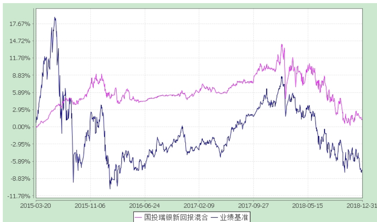
份额累计净值增长率与业绩比较基准收益率的历史走势对比图 (2015 年 3 月 20 日至 2018 年 12 月 31 日)

注：本基金建仓期为自基金合同生效日起的六个月。截至建仓期结束，本基金各项资产配置比例符合基金合同及招募说明书有关投资比例的约定。