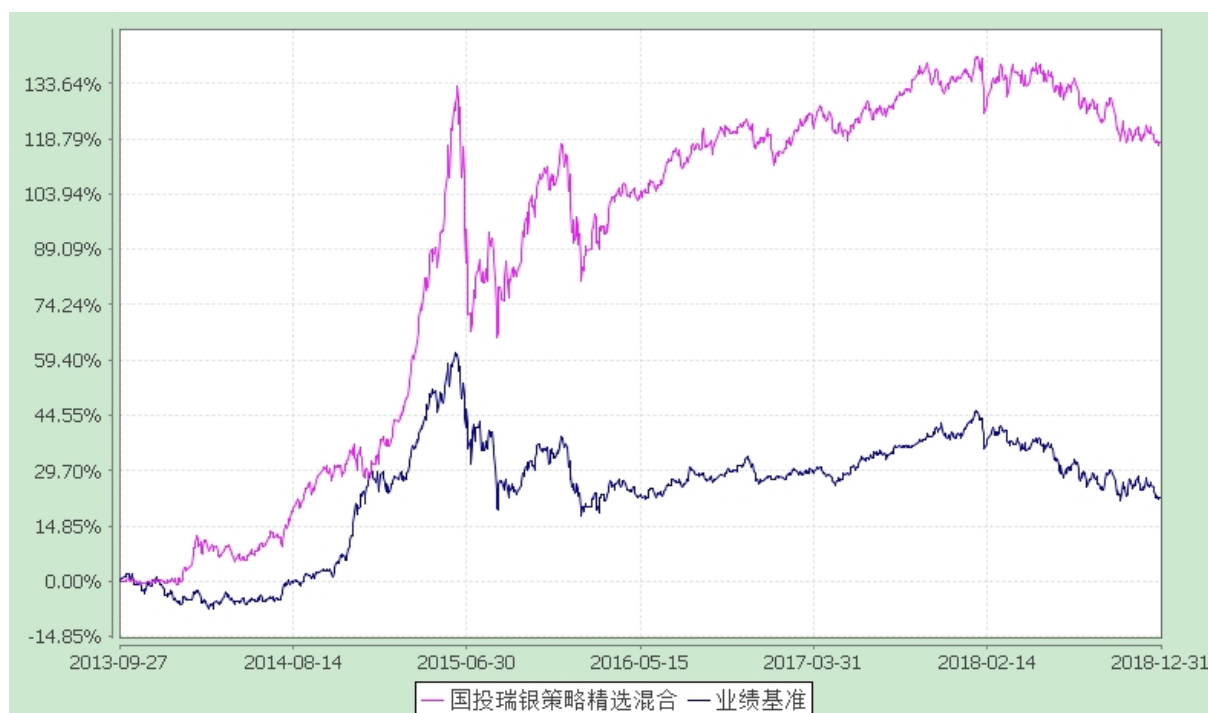
国投瑞银策略精选灵活配置混合型证券投资基金 份额累计净值增长率与业绩比较基准收益率的历史走势对比图 (2013 年 9 月 27 日至 2018 年 12 月 31 日)

注：本基金建仓期为自基金合同生效日起的 6 个月。截至建仓期结束，本基金各项资产配置比例符合基金合同及招募说明书有关投资比例的约定。