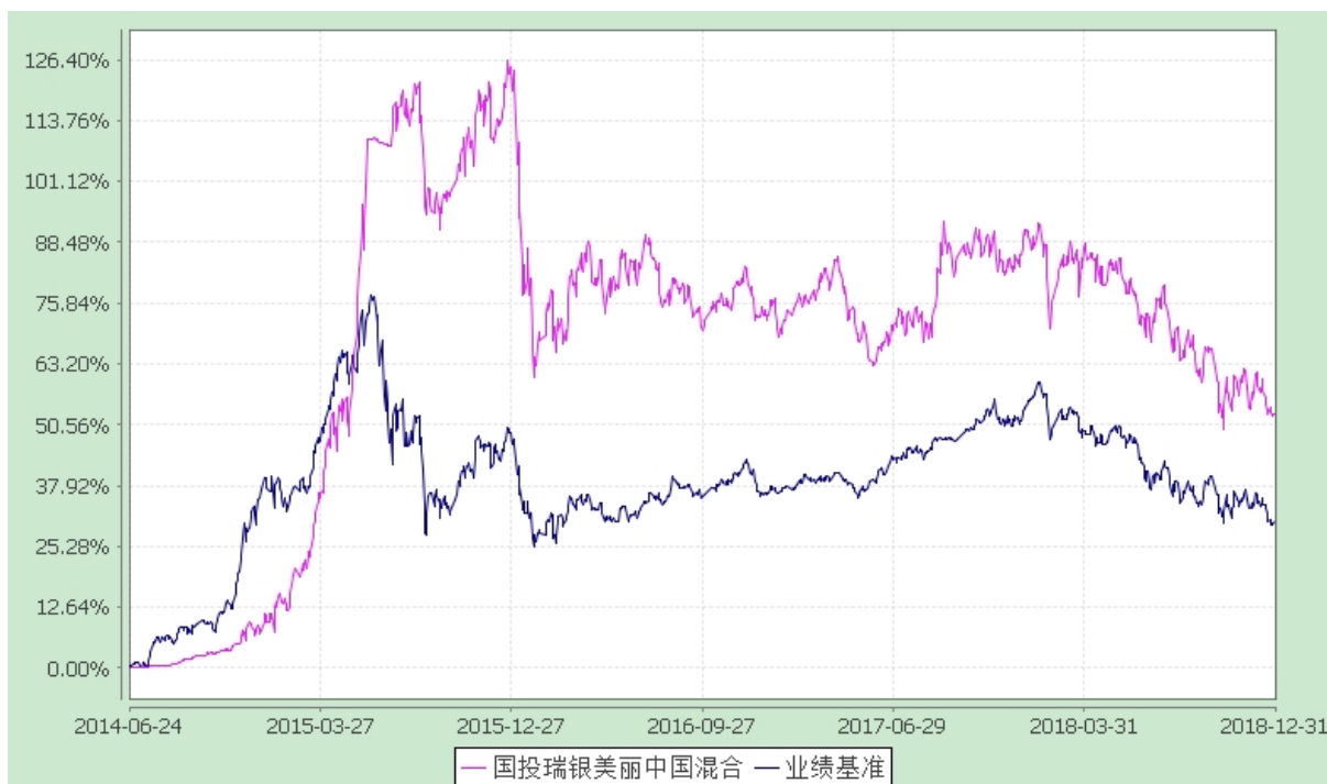
国投瑞银美丽中国灵活配置混合型证券投资基金 份额累计净值增长率与业绩比较基准收益率的历史走势对比图 (2014 年 6 月 24 日至 2018 年 12 月 31 日)

注：本基金建仓期为自基金合同生效日起的 6 个月。截至建仓期结束，本基金各项资产配置比例符合基金合同及招募说明书有关投资比例的约定。